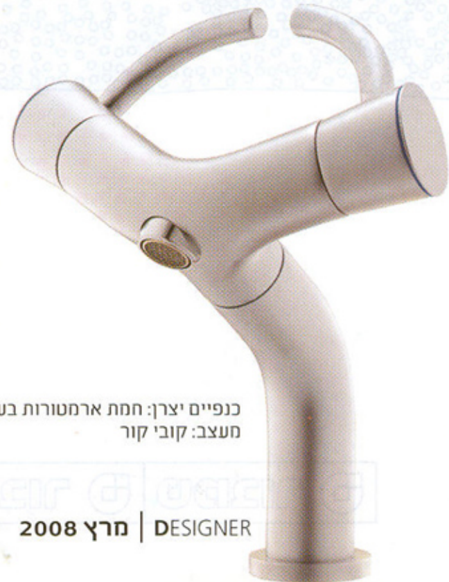
כנפיים יצרן: חמת ארמטורות בע"מ. מעצב: קובי קור